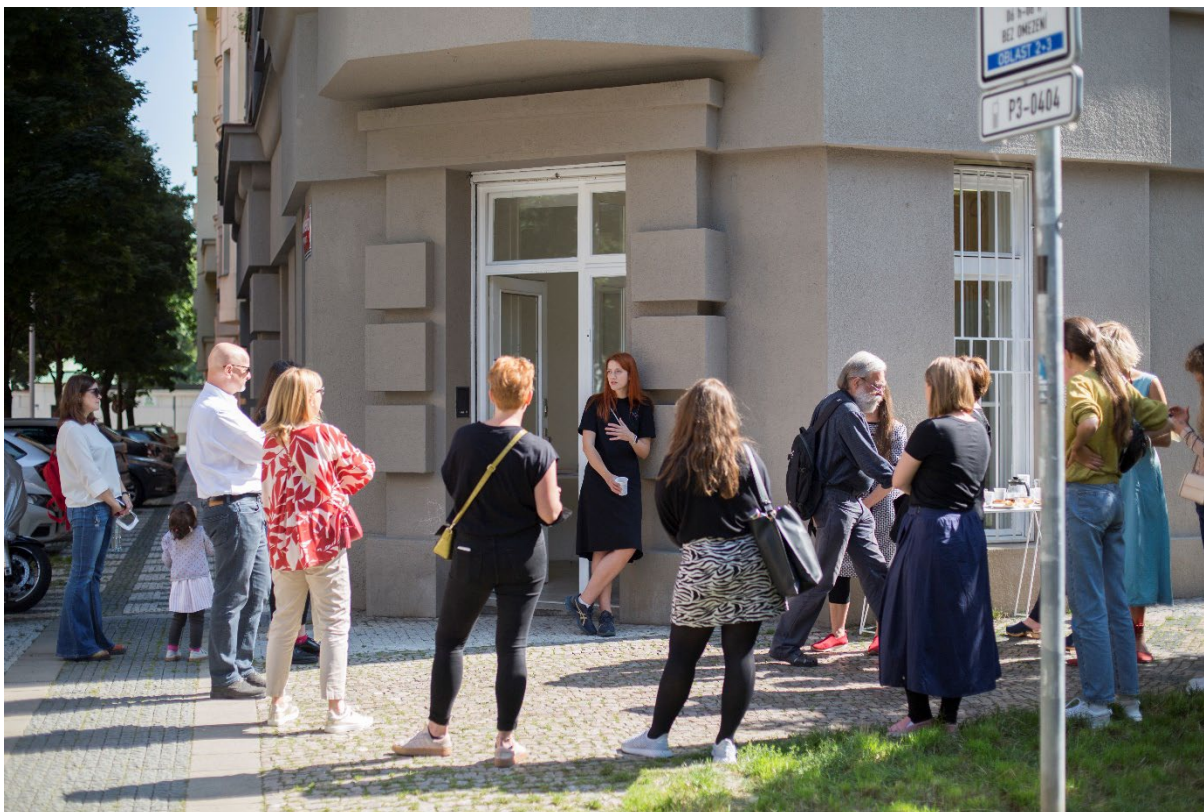
komentovaná prohlídka SUMO Prague