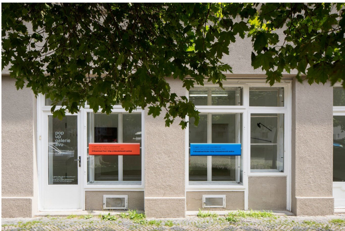
POP-UP Galerie AVU na Žižkově

Napsali o nás média česká (artalk.cz, skolaprofi.cz, iumeni.cz, bozskapraha.cz, respekt.cz, Respekt, czechmag.cz, Učitel'ské noviny, protisedi.cz, Art and Antiques, dolcevita.cz, artmap.cz, Lidové noviny, A2 kulturní čtrnáctideník, FlashArt) i zahraniční (gallerytalk.net, artviewer.org).