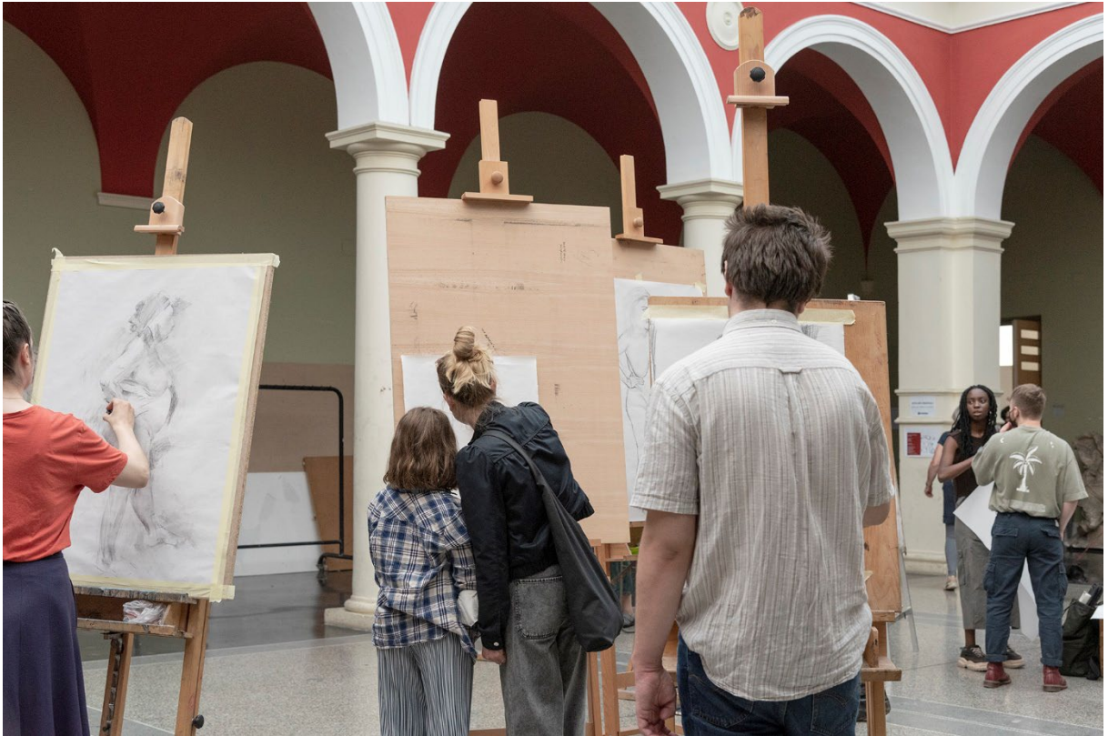
Kresba podle modelu vedená Vladimírem Kokoliou a absolventy*kami a studenty*kami ateliéru Grafika 2 / Moderní galerie