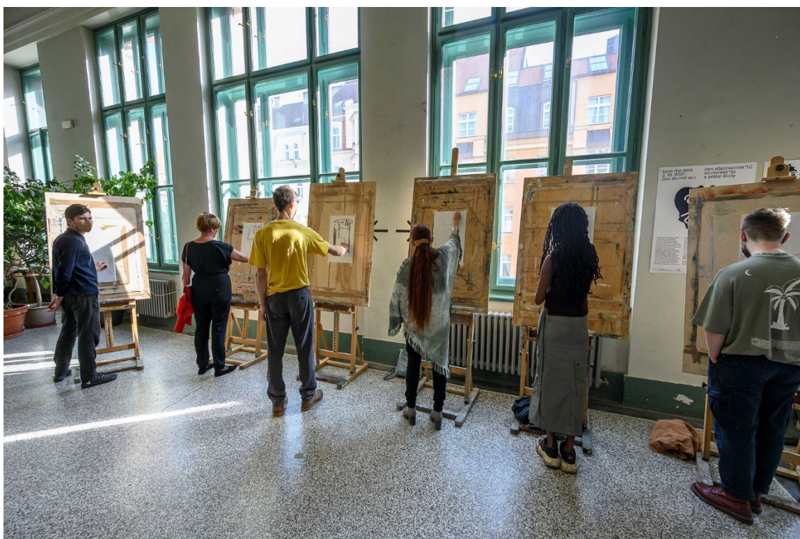
Kresba podle modelu vedená Vladimírem Kokoliou a absolventy*kami a studenty*kami ateliéru Grafika 2 / hlavní budova