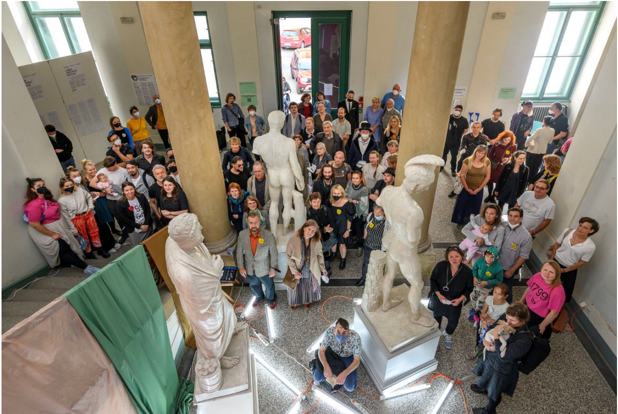
Společná fotografie