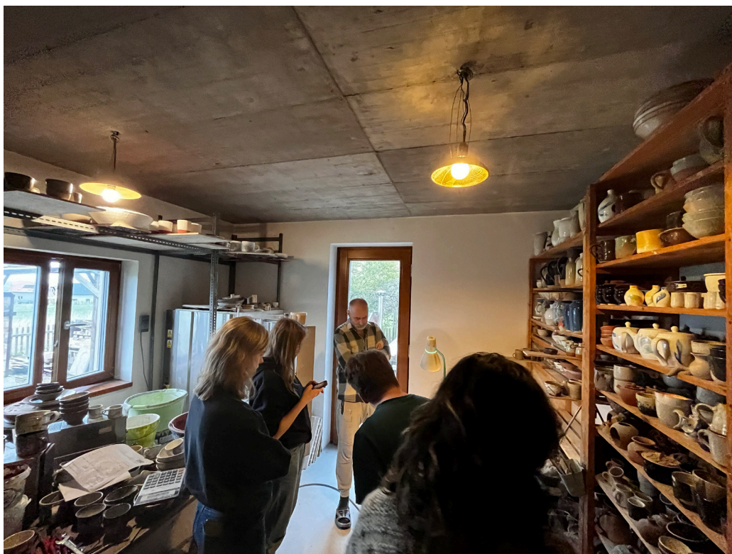
Výjezd do dílny Keramika Koller.