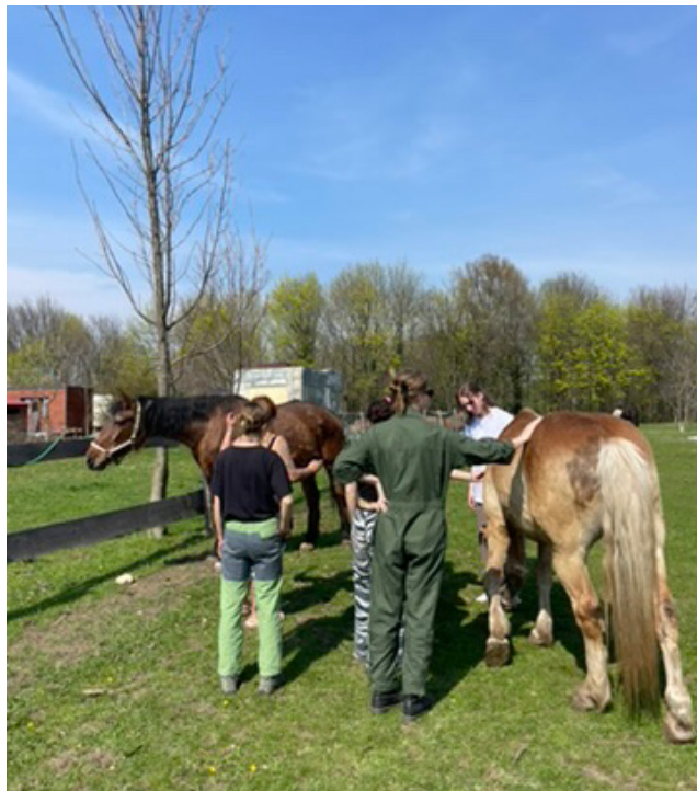
Prohlídka Komunitní zahrady Pastvina