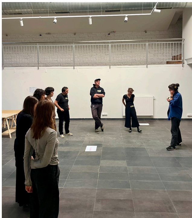
Workshop s lektorkami Re-setu

Workshopy, přednášky a exkurze v rámci předmětu tematizovaly současné krize společenského, environmentálního a geopolitického charakteru. Společně se studujícími jsme zkoumali jejich postoje a hledali dostupné cesty, jak se s důsledky mnohočetných krizí vyrovnat, jak můžeme mírnit jejich dopady na úrovni společnosti, organizací a jednotlivců, co je v našich silách coby jednotlivců a jakou budoucnost si